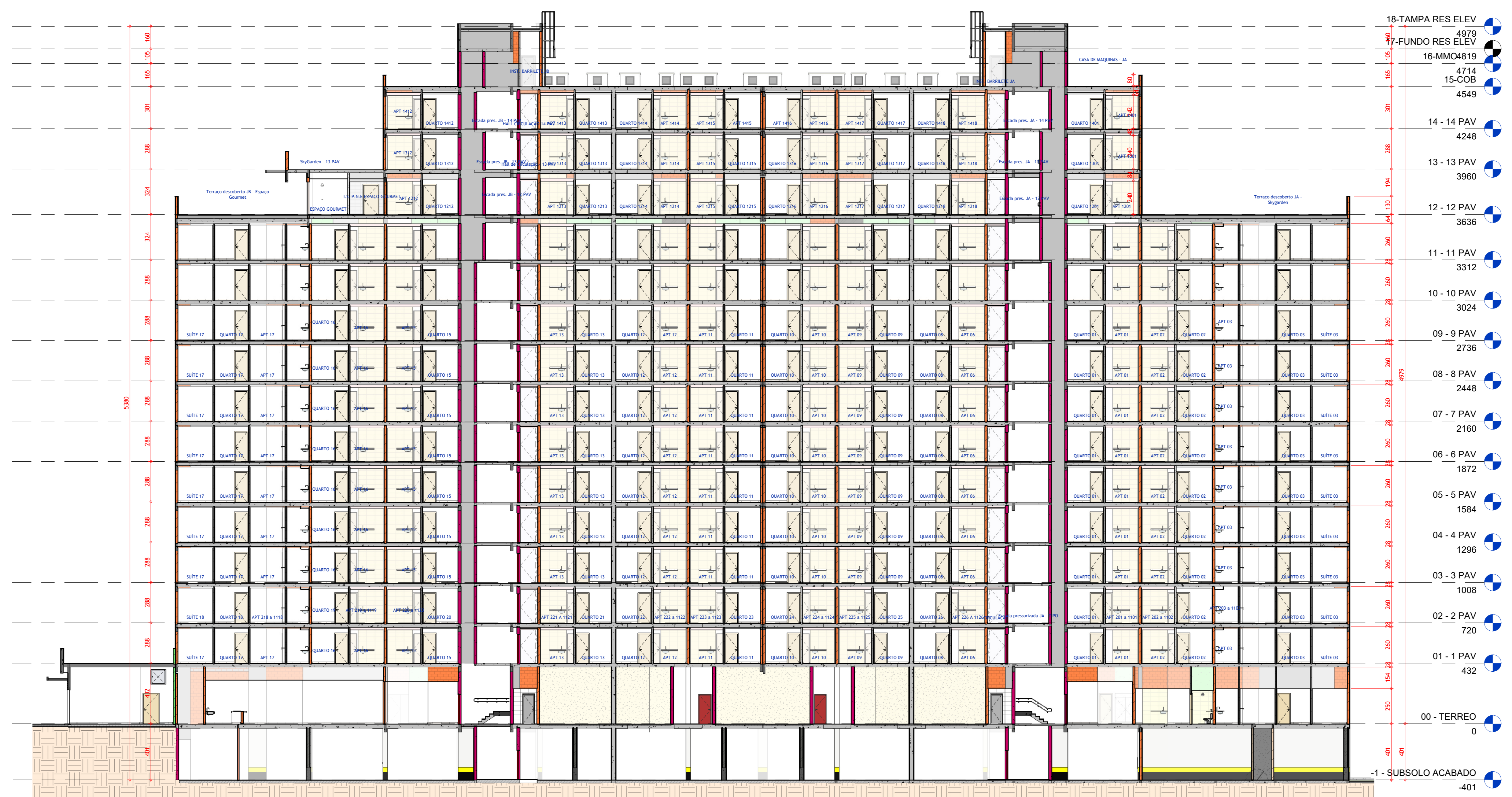
CORTE GERAL AA ESCALA 1 : 150